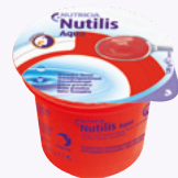
Nutilis Aqua Consistência Creme (Fase 2)

Procure sempre o aconselhamento dos profissionais de saúde que o acompanham.