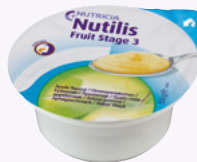
Nutilis Fruit Consistência Pudim (Fase 3)